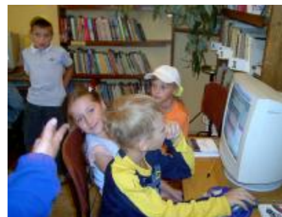
Naujenes Pirmskolas iestādes vecākās grupas bērnu