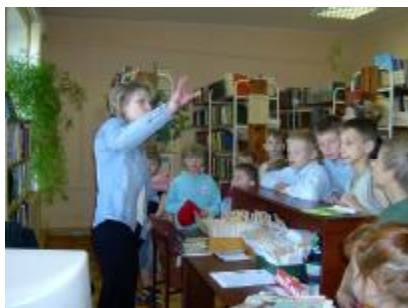
Bērnu vasaras nometnes “Zvaigžņu fabrika” ekskursija

Naujenes tautas bibliotēka un bibliotēkas Lociku filiāle (atrodas Kultūras centra telpās) aktīvi sadarbojas ar Naujenes kultūras centru, organizējam kopīgus pasākumus. Naujenes tautas bibliotēku 2006. gada laikā 2 reizes apmeklēja Naujenes pamatskolas 2-4. klases, skolēni, 1 reizi Lāču pamatskolas skolēni un divas reizes Naujenes pirmskolas iestādes vecākā grupa un Bērnu un jauniešu centra vasaras nometnes “Zvaigžņu fabrika” bērniem tika organizētas nodarbības bibliotēkā. Šo apmeklējumu laikā bibliotēka iepazīstināja bērnus ar bibliotēkas pakalpojumiem, VKKF programma “Bērnu žūrija”, bērnu grāmatu fondu un bibliotekāra profesijas iegūšanas iespējām, bibliotēkas elektronisko katalogu.