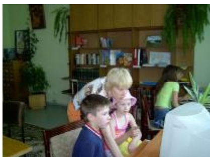
NEXT paaudzes ierūdītu pulciņa nodarbības

Lociku filiāles lietotāji, vairāk lasa grāmatas krievu valodā. Jaunā paaudze lasa grāmatas latviešu valodā. Ļoti populāras ir M.Stārastes, M.Cielenas, A. Brigaderes, K.Skalbes bērnu grāmatas.