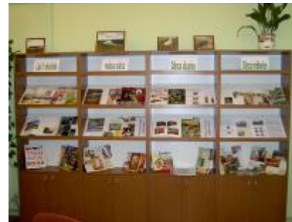
Literārā izstāde „Lai ir skaista mūsu sēta ”