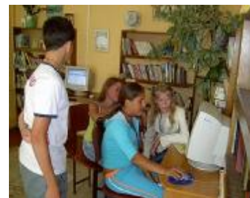
NEXT paaudzes erudītu pulciņa nodarbības