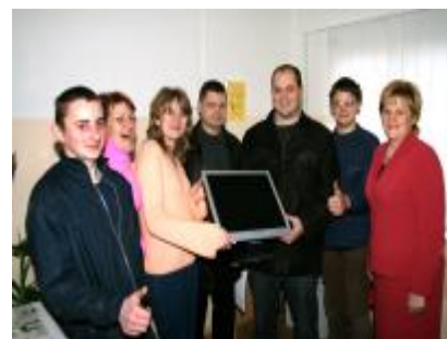
SIA „Dilar Trans” dāvina datoru Naujenes apkalpošanas punktam

Sākot ar 1999.gadu bibliotēka strādā pie bibliotēkas procesu automatizācijas. Ir iegādāti 14 datori ,7 printeri, 5 skeneri, 2 kseroksi. 6. darbinieku datori un 8. lietotāju datori . 2006.g. bibliotēkā iegādāti 4 datori, no kuriem divus iegādājamies uz bibliotēkas budžeta līdzekļiem, 1, datoru saņēma Valsts vienotās bibliotēku informācijas sistēmu(VVBIS) programmas ietvaros un 1. datoru mums uzdāvināja SIA „Dilar Trans” Ir pastāvīgā interneta pieslēgums. Instalēta IS “Alises 3i” programma( pamat konfigurācijas – komplektēšana, katalogizācija, administrācija, analītika, novadpētniecība, svītrkodu druka, saņemšanas/izsniegšanas un lasītāju reģistrācija). 25.-26.aprīlī 2006.gadā visi bibliotēkas darbinieki apguva šo programmu. Bibliotēkas lietotāji, tika apmācīti izmantot bibliotēkas elektronisko katalogu un internetu. 2006.g. Naujenes TB abonementa lietotājus apkalpot automatizēti. 2007. gadā plānojam arī Lociku filiāles lietotājus apkalpot elektroniski izmantojot Alises 3i programmu.