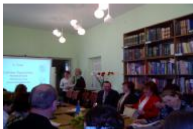
Naujenes pagasta padomes tikšanos ar jauniešiem „Latvija- Neatkarības gados”