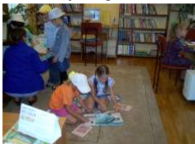
Naujenes pirmskolas iestādes Vecākas bērnu grupas apmeklējums

Gada laikā Bērnu lasītavu apmeklēja Naujenes Pirmskolas iestādes vecākas grupas bērni un Lāču un Naujenes pamatskolas audzēkņi.