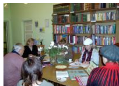
Daugavpils rajona padomes skate „Daugavpils rajona pašvaldību kultūras iestāžu darbības kvalitāte” 2006.gada 1.novembrī.

2006. gadā 25-26.04.Naujenes TB 6 darbinieki – apmeklēja 14 st. IT „Alises” kursu “Novadpētniecības datu bāze, WebPac”, šie kursi tika organizēti Naujenes tautas bibliotēkā. Trīs bibliotēkas darbinieki apmeklēja „VVBIS datorzinību pamat kursus” – 40 st. Un trīs bibliotēkas darbinieki apmeklēja 60 st. „Latviešu valoda bibliotēkzinātnē”. Sadarbības ietvaros ar Daugavpils rajona Ilūkstes pilsētas bibliotēku, tika organizēti IT”Alises ” kursi „Alises 3i programma”, kur abu bibliotēku darbinieki tika apmācīti strādāt ar Alises 3i programmu, kursi tika organizēti Naujenes tautas bibliotēkā. Šo kursu rezultātā visi bibliotēkas darbinieki, var strādāt ar „Alises” programmu un apkalpot bibliotēkas lietotājus automatizēti.