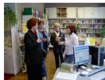
Šederes bibliotēkas apmeklējums