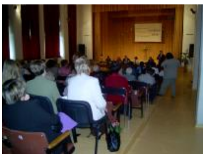
Daugavpils rajona 5. Grāmatu svētki

Viens no lielākajiem pasākumiem, ko organizēja Naujenes tautas bibliotēka 2006. gadā bija Daugavpils rajona 5. grāmatu svētki, kuri notika Naujenes pagasta Lociku ciemā Naujenes kultūras centrā, 25. augustā, ko apmeklēja 495 Daugavpils rajona iedzīvotāji.