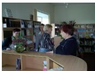
N.Zeile pieredzes apmaiņas braucienā Limbažu rajonā bibliotēkās