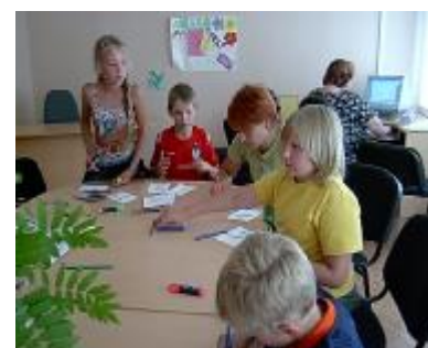
Naujenes tautas bibliotēkas Vecstropu apkalpošanas punkta Bērnu vasaras nodarbinātība

Vecstropu AP lietotāji lasa grāmatas, krievu valodā. Ļoti populāras ir F. Neznanska, M. Serova, A. Marininas, D. Doncovas, N. Robertas, D. Stilas grāmatas.