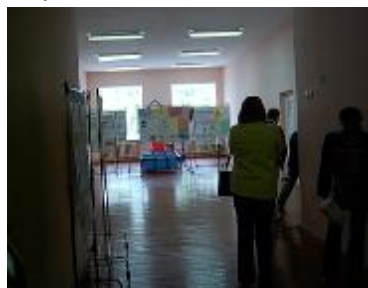
Zīmējumu konkurss „Mana mīļākā grāmata”