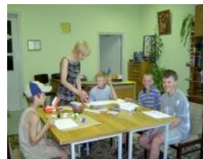
Bērnu vasaras nodarbinātība

Studenti izmanto nozaru literatūru – psiholoģijā, ekonomikā, sociālās zinātnes. Vecākā paaudze, lasa grāmatas, brīvā laika pavadīšanai. Ļoti populāri ir Dena Brauna, S.Brauna, D.Stīlas N.Robertas, A.Marininas, F. Neznanska literārie darbi.