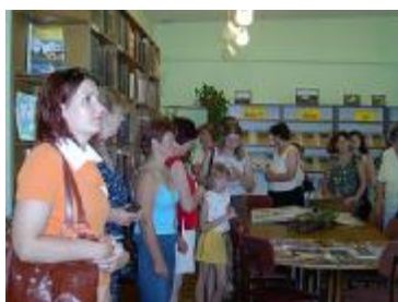
Preiļu rajona bibliotēku darbinieku delegācija

Šogad Tautas izglītības un kultūras centrs bija organizējis pieredzes apmaiņas braucienu uz Šederes bibliotēku un Limbažu rajona bibliotēkām. Kurš bija ļoti noderīgs, bija iespēja salīdzināt, uzzināt par jaunām darba metodēm ar bērniem un novadpētniecības darbu. Šogad pieredzes braucienu rezultātā Naujenes TB apmeklēja Preiļu rajona bibliotēku darbinieki.