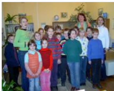
Naujenes pamatskolas 2- 3. klases apmeklējums