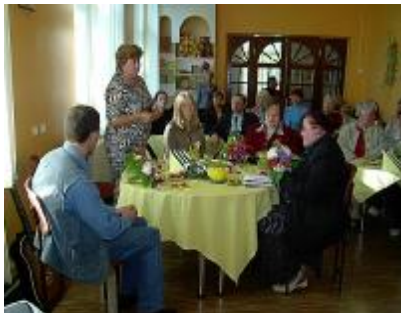
Dzejas dienas Naujenē